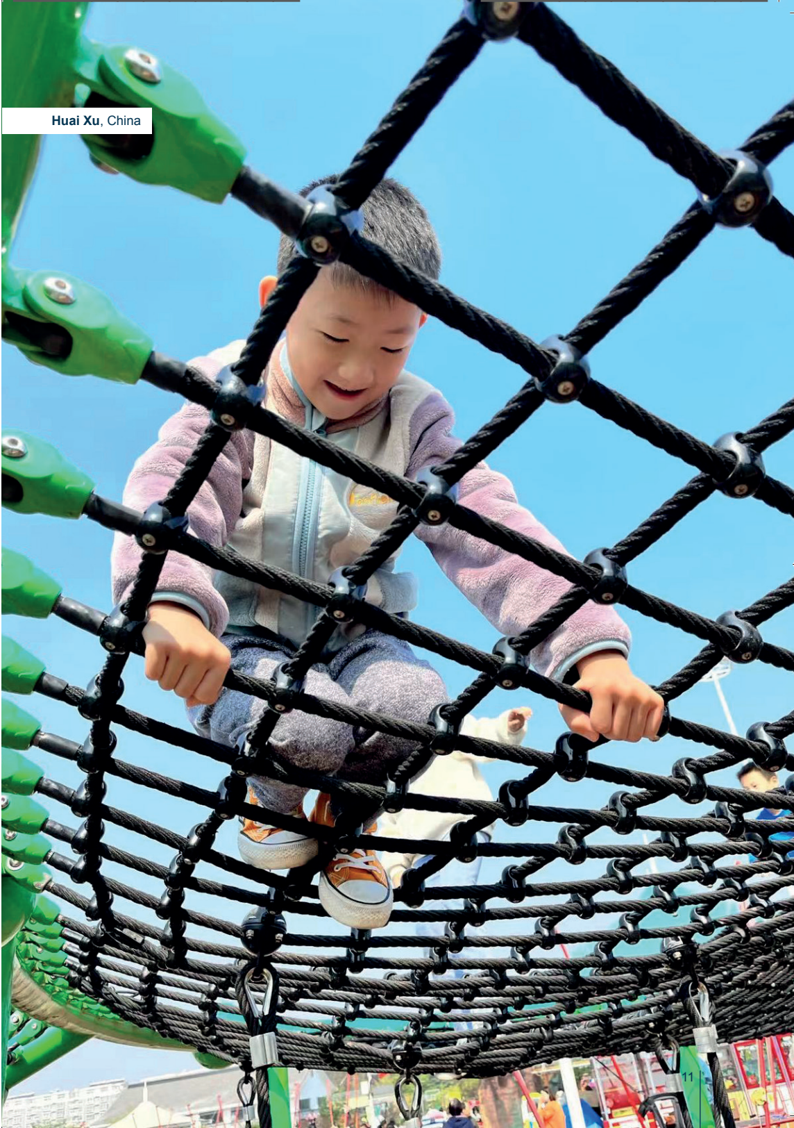
Huai Xu, China